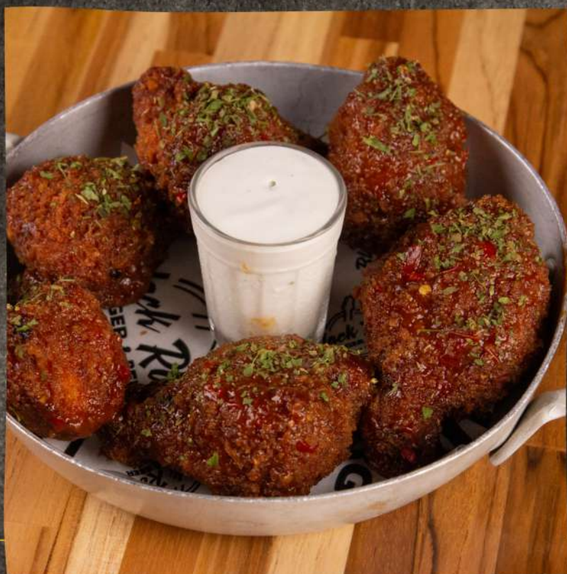
BUFFALO WINGS > $ 56,9 09 unids | Coxinha de frango empanada na farinha panko, envolta em molho picante.