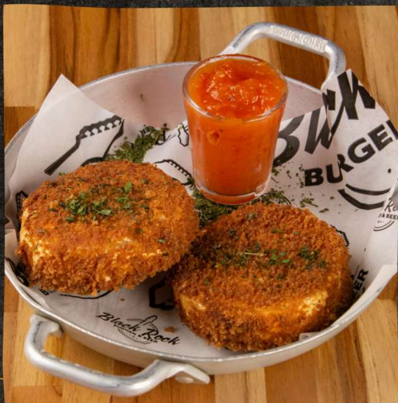
CAMEMBERT EMPANADO > $ 47,5 02 unids. | Acompanha geléia de pimenta.